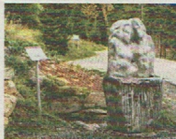
Kupplerbrunn – Liebesbrunnen

Eberstein ist zugleich das Hauptportal in die einzigartige Landschaft der Saualpe – jenem 30 km